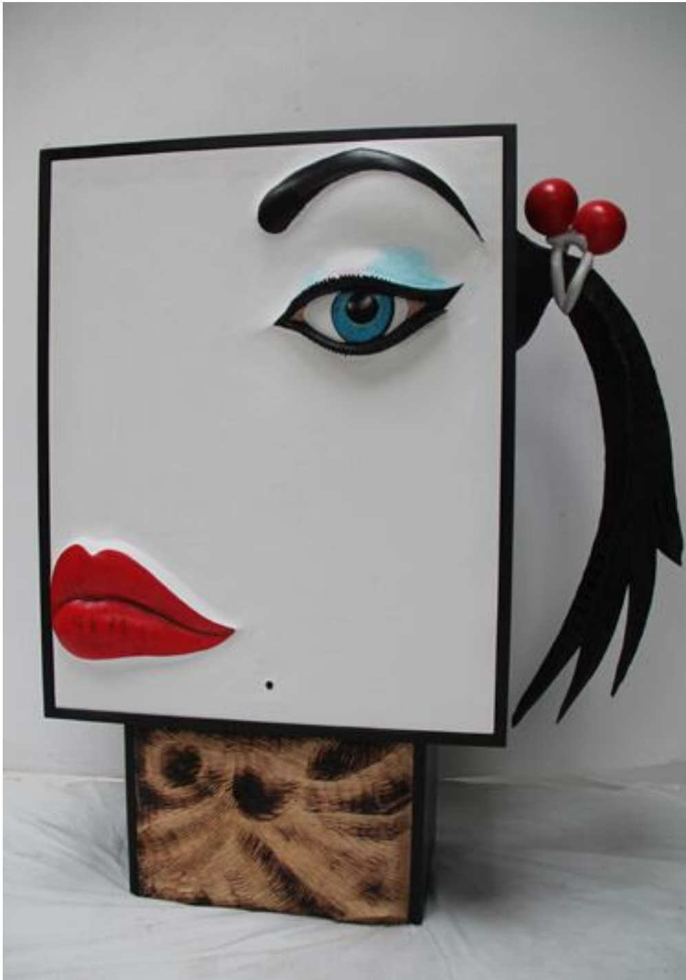
Thierry Laudren (35)

Quelques photos d'ensemble de l'édition 2017